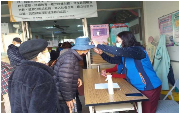
落實做好防疫量體溫