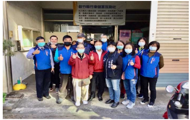
感謝辛苦的志工幹部們