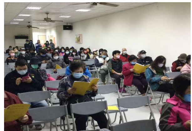
謝謝社員們一同對社之向心力