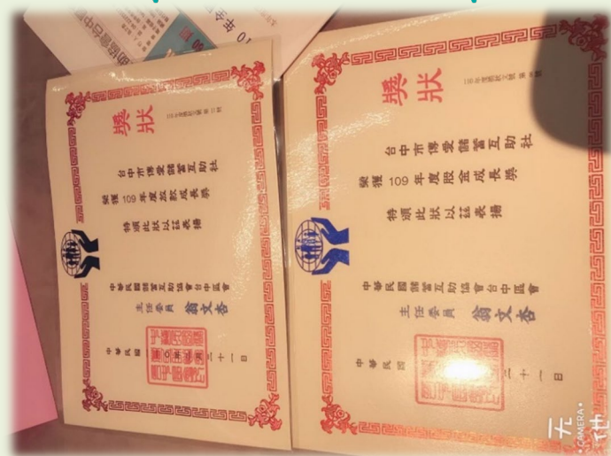
110年全國業務成長獎狀及股金成長獎狀