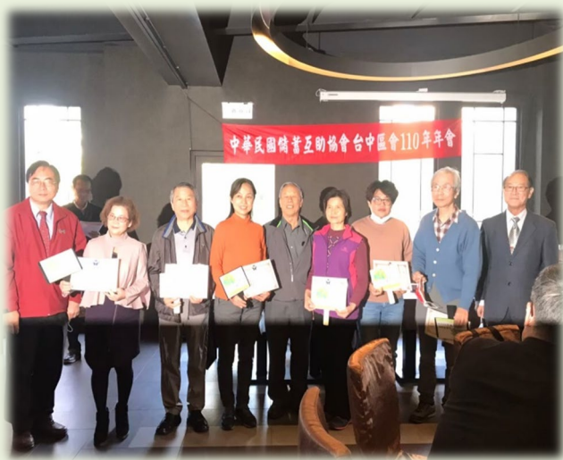
110年年會及社幹部聯誼110年2月21日